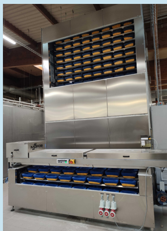
Opět v Polsku, jen v jiné pekárně a o čtvrtstoletí později