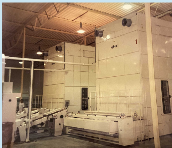
Devadesátá léta – dvě chlebové linky do Polska

Při vší skromnosti můžeme s hrdoostí konstatovat, že toto vše se nám podařilo. Velmi se nám vyplatilo rozhodnutí udržet se na východních trzích i v době, kdy ostatní firmy odtamtud hromadně utíkaly. Velké zakázky do Ruska a dalších zemí nám pomohly firmu stabilizovat. Postupně jsme se zaměřili na dodávky vysokovýkonných průmyslových kontinuálních linek na tvarování, kynutí a chlazení různých druhů chleba včetně formového a toastového, dále běžného a jemného pečiva, pizzy, ciabatty, preclíků a dalších druhů výrobků. Naše linky jsou „šité na míru“ konkrétním zákazníkům nejen z hlediska rozměrů kynáren a uspořádání strojů s ohledem na konkrétní prostory výrobních hal (umíme třeba i kynárny z patra do patra!),